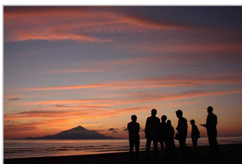
■天気の良い日は夕日ツアーあり